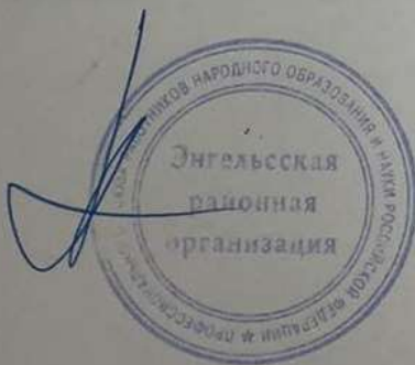
Рис. N 1170/23 - ED